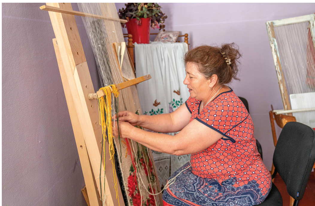
Socol Alexandra, satul Țareuca, Rezina

Indicele Îmbătrânirii Active se calculează pentru populația de 55 ani și peste, este rezultatul unui panel cu indicatori multidimensionali care sunt apoi agregați în măsuri compozite și prin care se măsoară situația actuală în patru domenii aferente îmbătrânirii active și sănătoase (Figura 1).